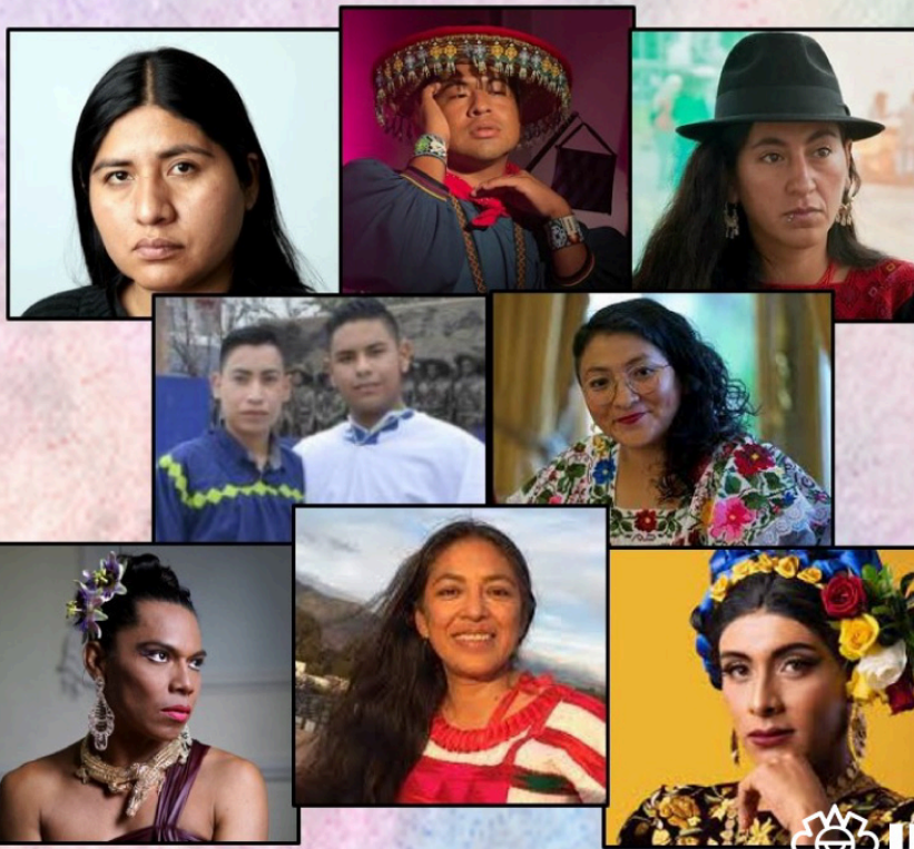
Activistas y artistas