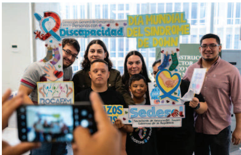
Tegucigalpa, 12 de marzo de 2024

En el Día Mundial del Síndrome de Down, la Secretaría de Desarrollo Social (SEDESOL) recibió la visita de la Asociación Familias Rompiendo Cadenas (ROCAFAM) para conmemorar este día, fomentando la inclusión y aceptación con el personal mediante la Campaña Abrazos Gratis. En este evento tan significativo, también estuvieron presentes funcionarios del Centro Hondureño para el Estudio de Políticas de Estado en el Sector Social (CHEPES), reafirmando su compromiso con la inclusión social.