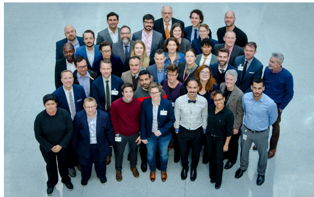
Imagen 2. Consultas en persona acerca de los indicadores del Índice de Inclusión LGBTI

Estas finalidades, que otorgan prioridad a las comparaciones entre países y a lo largo del tiempo, son los objetivos principales utilizados para justificar los indicadores preliminares que se presentan más abajo.