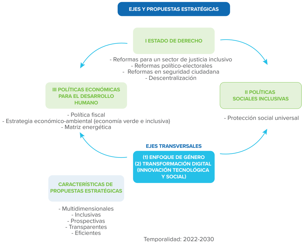
Diagrama 2 Visión de los ejes estratégicos para la transformación nacional (2022-2030)

Fuente: Equipo del Informe de Desarrollo Humano Honduras