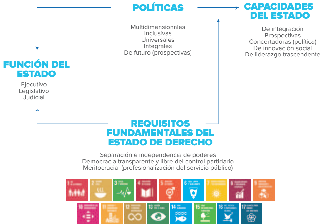
Diagrama 1 Hacia una visión estratégica del Estado hondureño en el siglo XXI 2022-2030

Fuente: Equipo del Informe de Desarrollo Humano Honduras